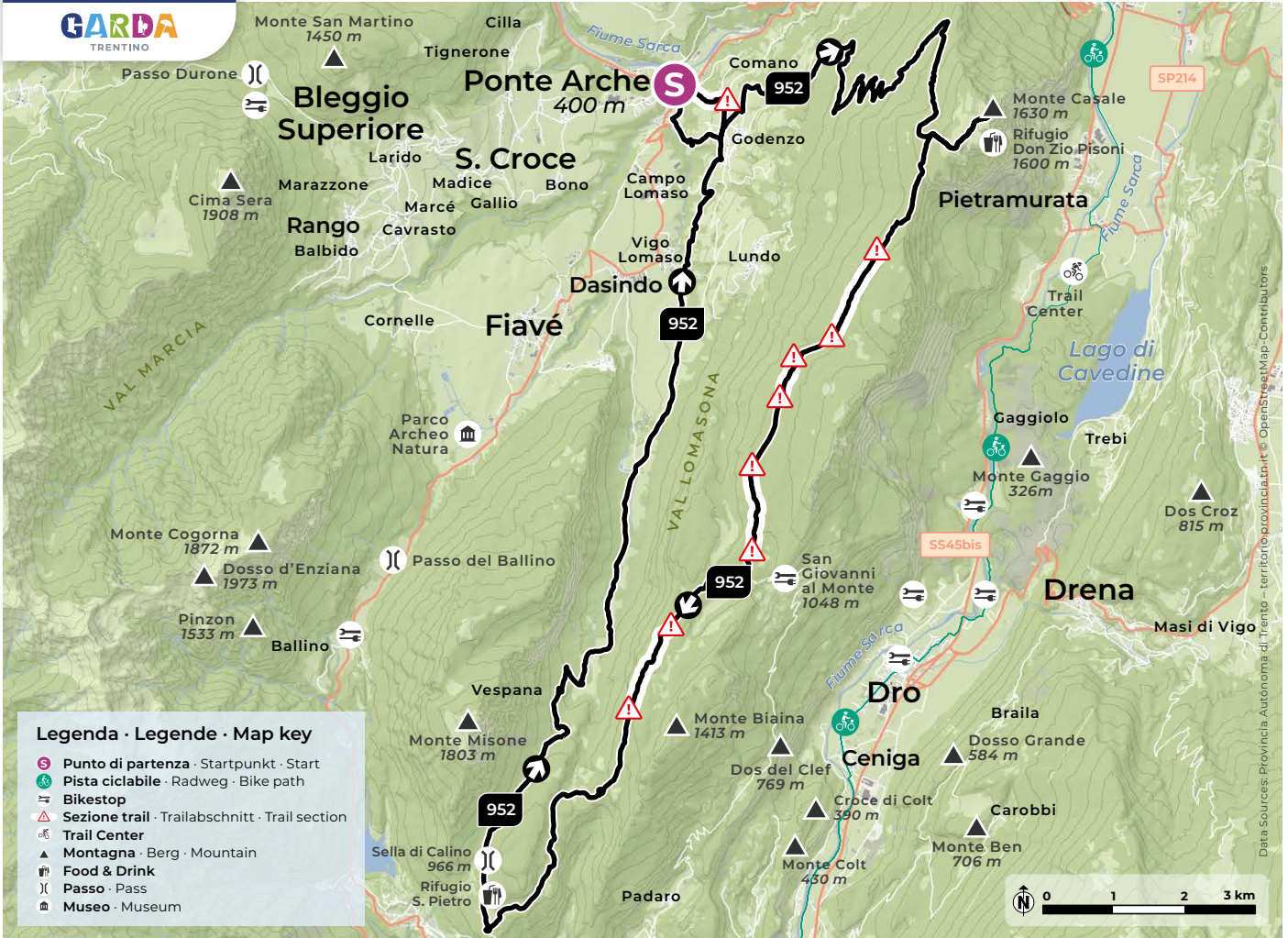
Design and cartography 2024 | max2.at